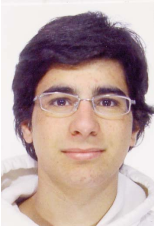
Giorgio Trentacoste Rotary Club Trapani