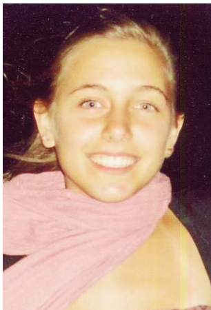
Amarilli Varesio Rotary Club Giarre