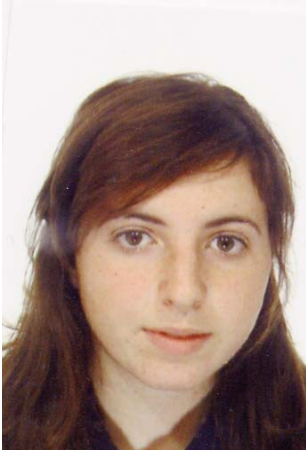
Flora Panvini Rotary Club Etna Sud Est